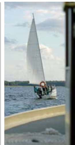
Vorfahrt achten: Besonders im Sommer ist auf dem Wasser viel los (oben). Aber wenn es mal eng wird, reagieren die Crews gelassen. Auch die Kanäle sind bequem und breit (unten).

Am nächsten Tag erwartet uns das einzige echte Hindernis im Revier: eine Drehbrücke. Sie ist zum Teil aus Holz, wird mit einem großen Rad von Hand gedreht und vervollständigt mit ihren Blumenkästen die fast französische Atmosphäre des Lötzener Kanals und seiner Uferpromenade. Geöffnet wird tagsüber mehrmals, dennoch schadet es nicht, sich die genauen Zeiten vorher anzusehen.