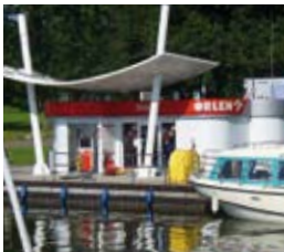
Tanken am Wasser: Macht in Polen wirklich Spaß, leider reicht unser Dieselvorrat locker für den ganzen Urlaub, so dass wir die schönen Tankstellen nur von weiten sehen.