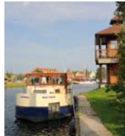
Gut angelegt: In den letzten Jahren sind viele moderne Marinas eröffnet worden, wie zum Beispiel der Port Mamry in Angerburg.

Gleich gegenüber vom Schwarzen Schwan entdecken wir einen weiteren Hafen – die Marina Evelyn, die mit einem großen Entsorgungszeichen wirbt. Das Absaugen klappt tadellos und hygienisch. Später sitzen wir gemütlich im Garten des schön eingerichteten Restaurants und lassen uns zum Mittag bekochen. Es ist wie immer in Polen: Lecker und eher billiger als bei uns. Wo das Essen so günstig ist, kann man gar nicht glauben, dass es 100 Zloty kostet, es als Inhalt des Fäkalientanks wieder loszuwerden. Was ist schon perfekt?