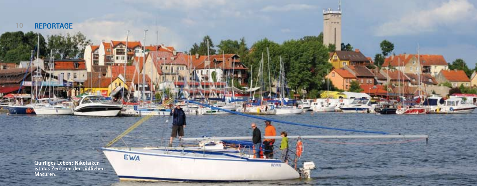
Quirliches Leben: Nikolaiken ist das Zentrum der südlichen Masuren.