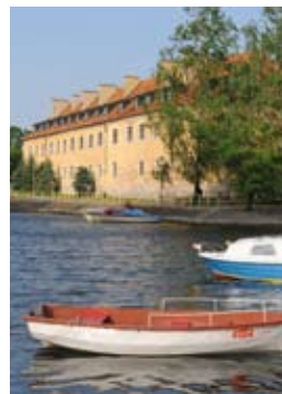
Sackgasse 15 Kilometer vor Russland: Das kleine Hafenbecken vor Schloss Angerburg ist der nördlichste Punkt des Reviers.