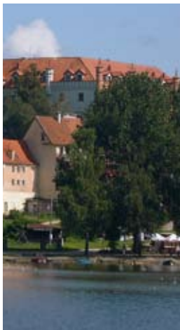
Der Ort Rhein (oben) ist ein Abstecher in die Talter Gewässer wert. Er bezaubert mit der Burg Ryn, einem schönen Anlegesteg und wenig Badeort-Kommerz, anders als Nikolaiken (unten), wo man sinnfreie, aber auch schöne Andenken kaufen kann.