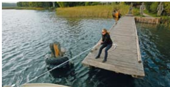
Von Göttern bewacht: Galindia erinnert an einstige Pruzen-Siedler und ihre Bootsbaukunst (oben).