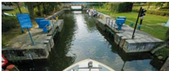
Schleuse mit Schichtzuschlag: Das Schleusen kostet je nach Tageszeit unterschiedlich, aber für die Aussicht auf einen einsamen Ankerplatz im Roschsee (unten) lohnen sich auch 12 Zloty.