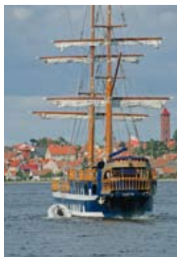
Wasser als Erlebnisraum: Das große Herz der Polen für Wassersportler zeigt sich an der Vielfalt der Angebote (oben) und an der sorgfältigen Beschilderung der Verbindungskanäle (unten).