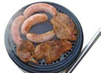
Kaum gekauft, schon in Polen: Unseren neuen High-Tech-Grill konnte man in Angerburg schon.

Der nächste Tag bringt einen Besuch im Freilicht-Museum, das nur ein paar Schritte von unserem Anlegeplatz entfernt ist. Alles kann man hier anfassen und selber machen. Teppiche weben, Korn mahlen. Die Museums-hüterin spricht weder deutsch noch englisch, aber sie ist bemüht, alles mit Händen und Füßen zu erklären und vorzumachen. Den Rest erledigt unsere Vorbildung, schließlich sind auch wir von unseren Eltern in Museen geschleppt worden.