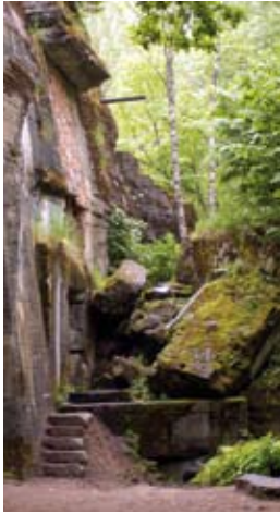
Geschichte entdecken: In den teilweise gesprengten Ruinen der Wolfsschanze (oben) kann man herumklettern und sich mit Gruseln vorstellen, wer hier gewirkt hat. Ehrfurcht und Respekt flößen dagegen das baufällige Schloss der Familie Lehndorff (unten) und die kleine Gedenkstätte ein.