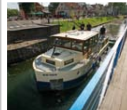
Einfaches Fahren: Zwei Schleusen und eine Drehbrücke bilden die großen nautischen Herausforderungen.