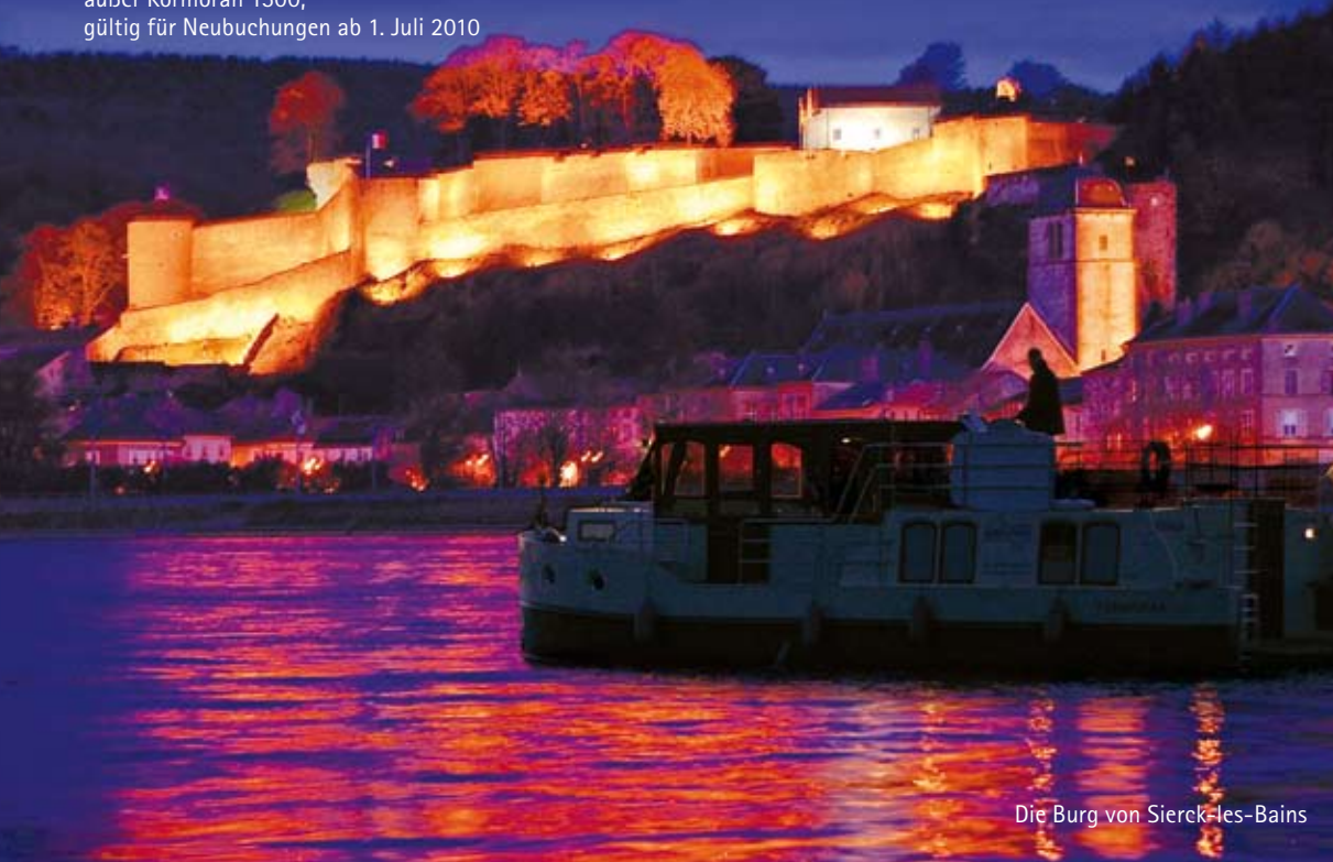
Die Burg von Sierck-les-Bains

an den den Basen Sierck-les-Bains und Niderviller außer Kormoran 1500, gültig für Neubuchungen ab 1. Juli 2010