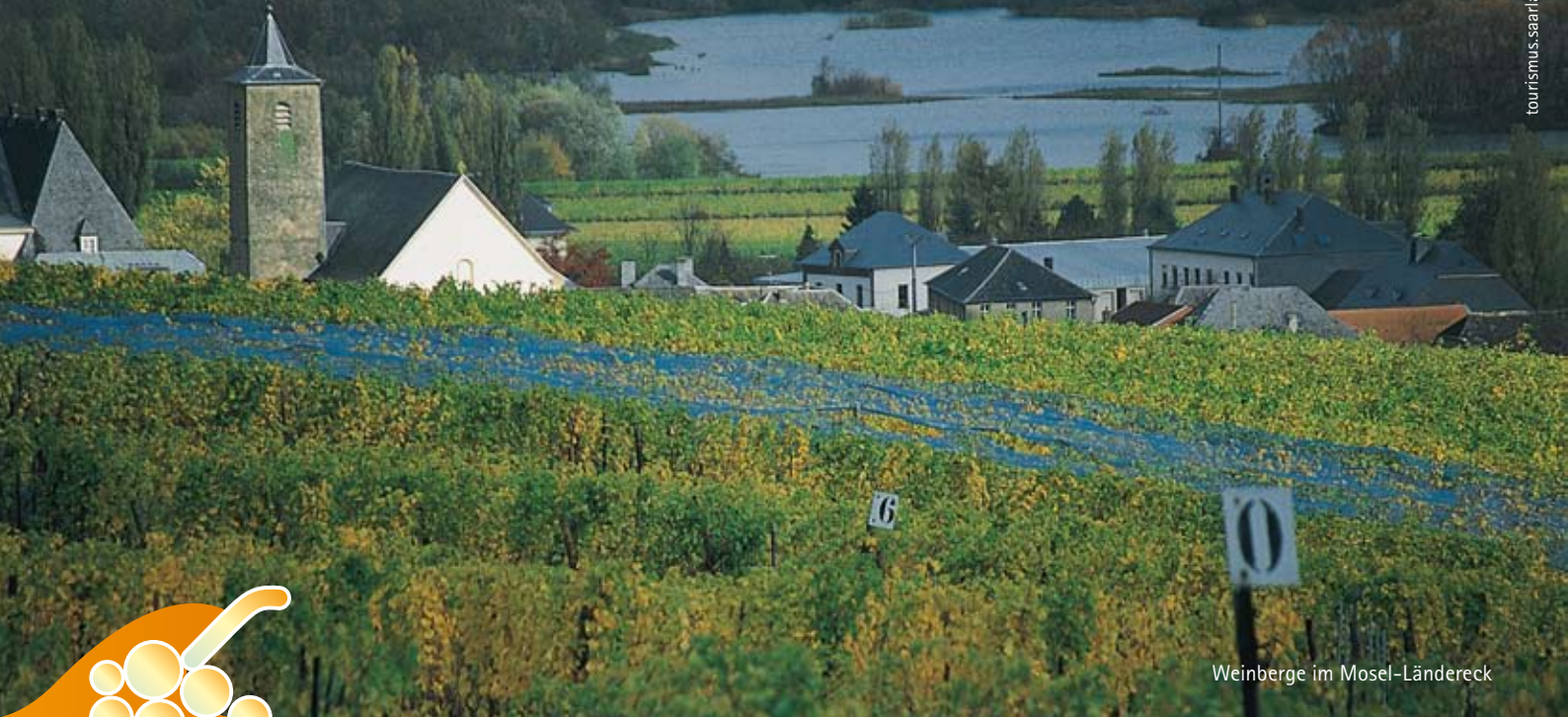
Weinberge im Mosel-Ländereck