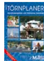
Törnplaner Mecklenburgische und Märkische Gewässer 10. Auflage 2011/2012 ISBN: 978-3-9806720-7-8, 15 Euro, für Charterkunden im entsprechenden Revier kostenlos